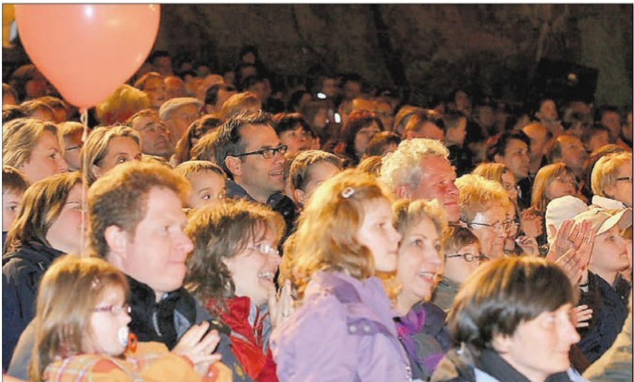
Das Publikum war von der frechen Pippi Langstrumpf bei der Premiere begeistert.